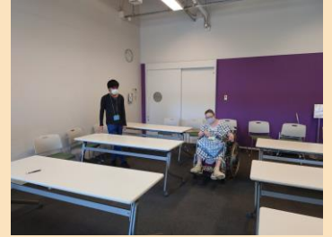
5/28 イベント 大人と子どもと不登校 @子ども未来センター